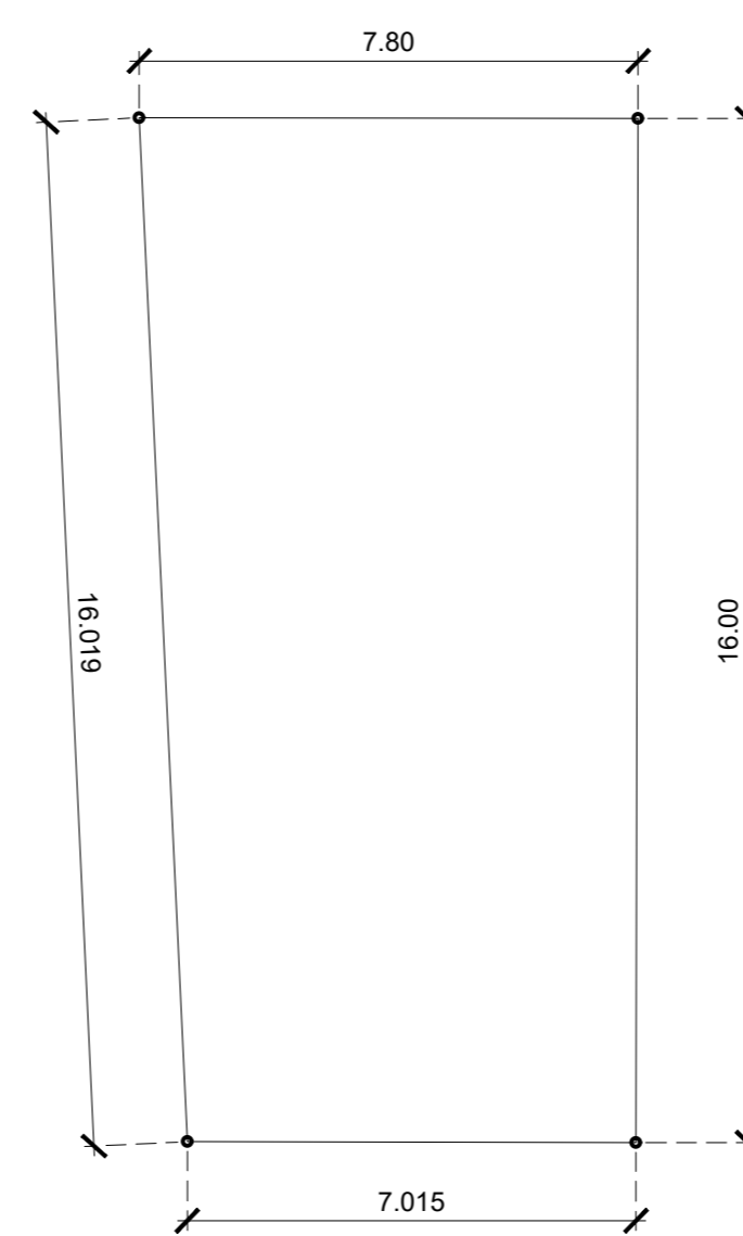
LOTE 47 AREA DE LOTE:118.50 M 2